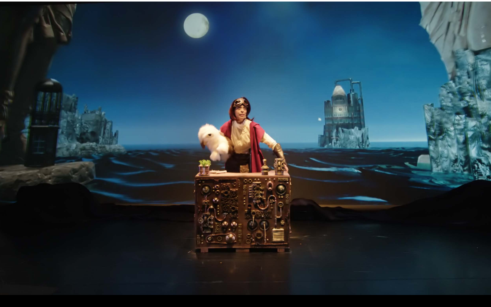
El principio del viaje